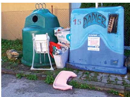
Triedenie odpadu na našom sídlisku

Predchádzať vzniku odpadu by malo byť základným pravidlom nášho správania. Ak odpad nevytvoríme, nemusíme sa zaoberať jeho triedením!