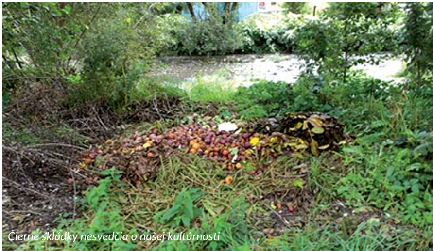
Čierne skládky nesvedčia o našej kultúrnosti

Do zelených kontajnerov na sklo nepatria znečistené fľaše a poháre, sklo s prímiesami, zrkadlá, keramika, porcelán, žiarovky, sklenené fľaše od chemikálií.