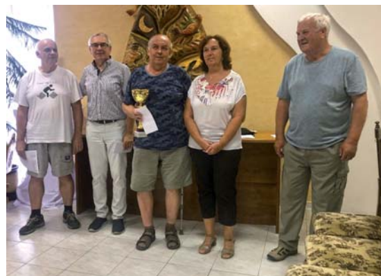
Ocenení šachisti turnaja o Pohár primátorky