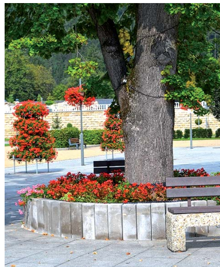
Pohoda pod lipou a Knihobúdka

Zariadenie pre seniorov Harmónia (v budove bývalej materskej školy) – vytvorenie zariadenia s dvomi bytovými jednotkami pre 12 seniorov