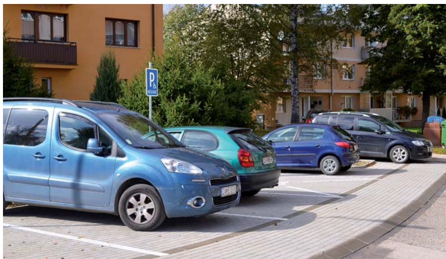
Nové parkovisko na Školskej ulici

Na Školskej ulici – medzi bytovými domami bolo vybudované parkovisko s 10 parkovacími miestami a stojisko na kontajnery.