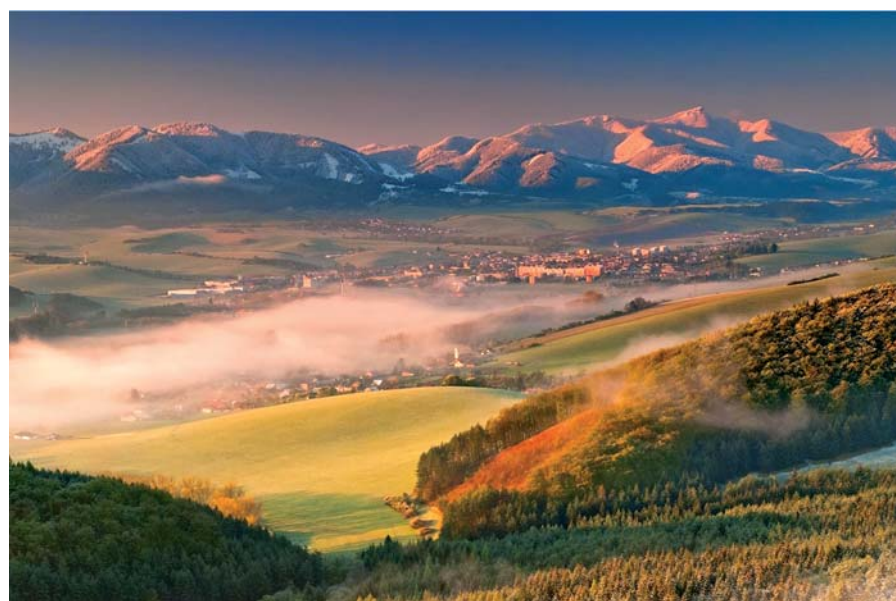
Ráno v Rajeckej doline (autor: Viktor Kobrték)

Tešíme sa na vzájomnú spoluprácu, ktorej cieľom je podpora rozvoja územia MAS Rajecká dolina.