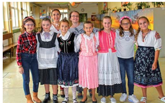
Veselica na ľudovú nôtu

Predmetové olympiády, i-Bobor, Klokank, Pytagoriáda, jesenné prázdniny, aktivity zamerané na finančnú gramotnosť, anglické predstavenie, anglický týždeň s lektormi, sviatok svätého Mikuláša, divadelné predstavenia, lyžiarsky a plavecký výcvik, Škola v prírode a mnohé ďalšie akcie a podujatia. Pripravuje sa aj rekonštrukcia asfaltového ihriska, nové oplotenie pri ihrisku, otvorenie relaxačnej miestnosti nielen pre ŠKD.