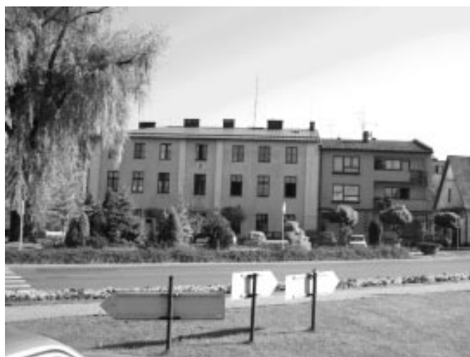
Pohľad na námestie a budovu úradu vo Wilamowiciach

Projekt poskytne priestor na ďalšie kultúrne programy počas Letných slávností a podporí stretnutia remeselníkov, podnikateľov i organizátorov regionálnej spolupráce v oblasti spoločensko-kultúrnych vzťahov.