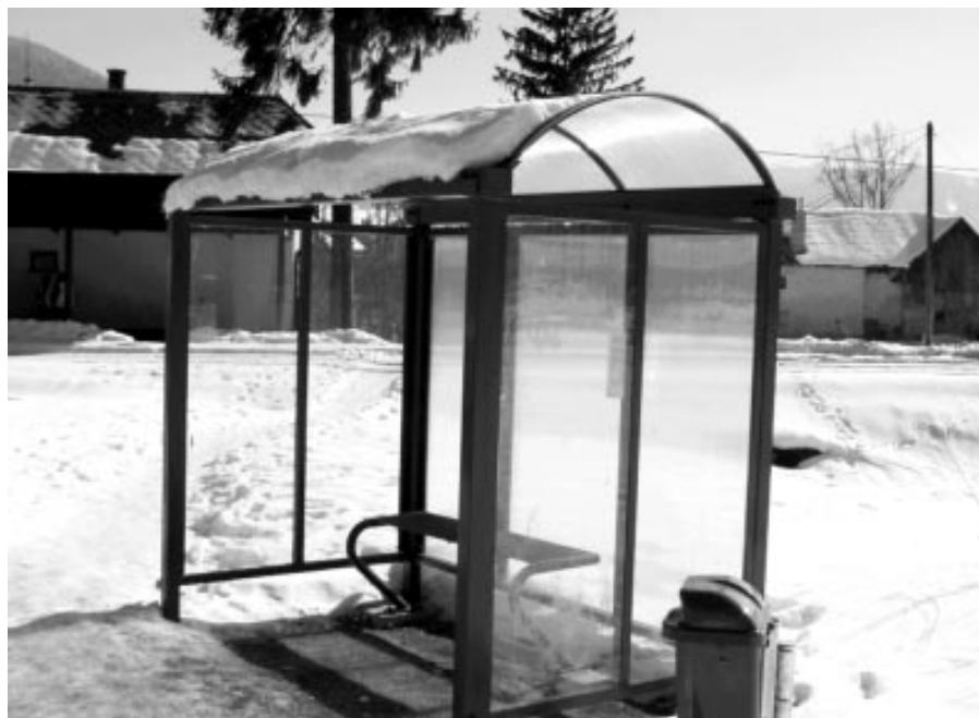
Nová autobusová zástavka v Poluvsí

Mesto Rajecké Teplice zabezpečilo a osadilo v decembri 2004 novú autobusovú zástavku pri železničnej stanici v Poluvsí. Ostáva nám dúfať, že nebude poškodzovaná vandalmi a investícia v sume 100.000.- Sk, bude nerušene slúžiť našim občanom, ale aj ostatným cestujúcim.