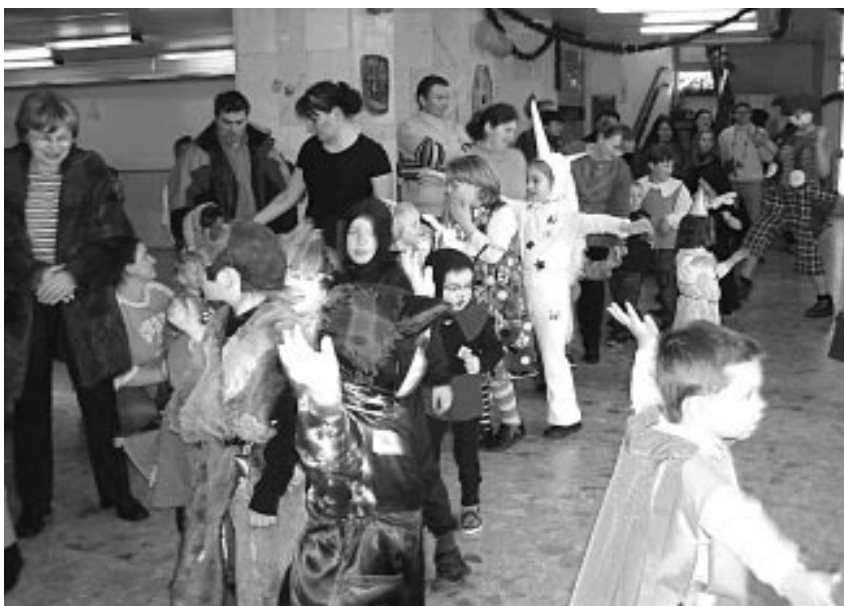
Zabávajúce sa deti na maškarnom plesu

Tradične vo fašiangovom období, plnom zábavy a plesov, sa v nedeľu 30. 1. 2005 uskutočnil pre deti maškarný ples. V príjemnej atmosfére 33 detských masiek spolu s rodičmi a starými rodičmi strávili spoločné nedeľné popoludnie. Dobrovoľníci z divadielka Makovice zo Žiliny sa postarali o dobrú zábavu, súťaže a hry, ktoré dominovali tomuto podujatiu. Mesto Rajecké Teplice ďakuje všetkým, ktorí pomohli pri organizovaní a pri úspešnom priebehu detského maškarného plesu.