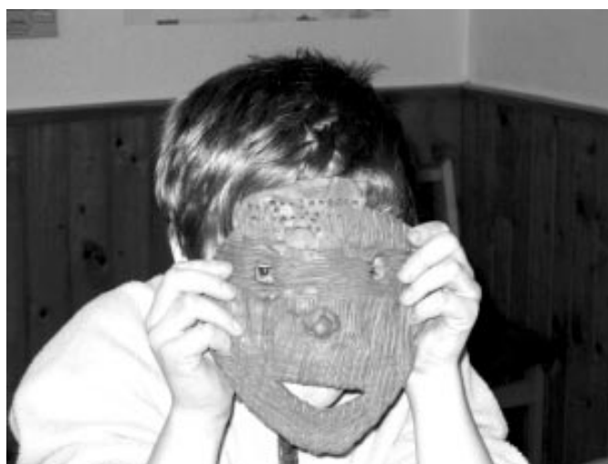
Deti vyrobili naozaj pekné Africké masky.

Usmiate a žiariace tváre nasvedčovali, že akcia bola úspešná. Každý dostal na cestu sladkosť. Vyrobené masky budú vypálené a po výstave na Mestskom úrade si ich deti budú môcť zobrať domov.