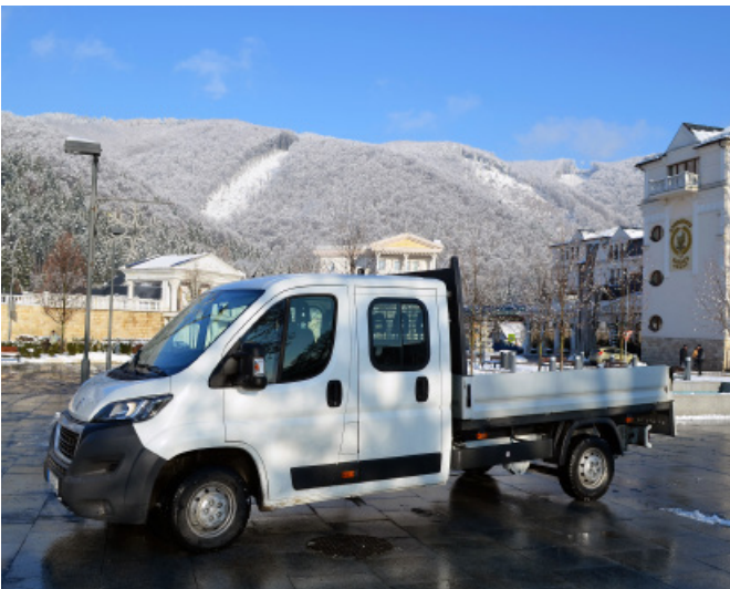
Mesto zakúpilo vozidlo Peugeot Boxer Valník, ktoré je veľkým pomocníkom pri plnení každodenných pracovných povinností pracovníkov oddelenia technických služieb