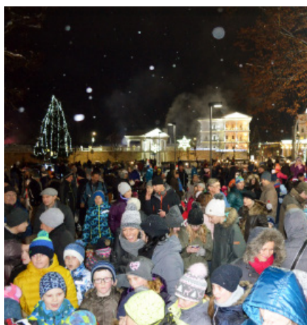
Mikuláš zaplnil námestie