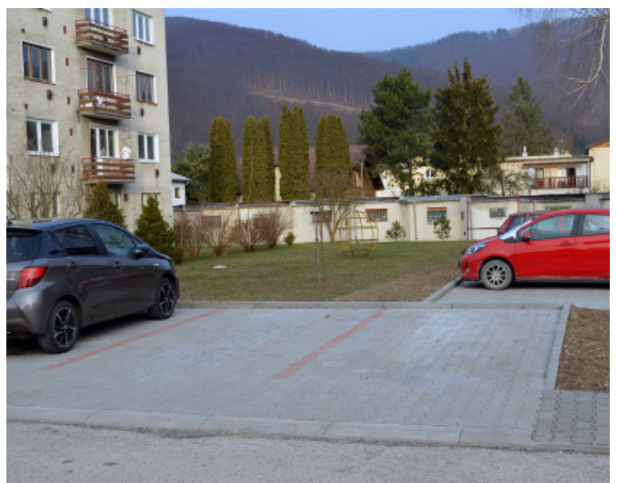
Obyvateľom Pionierskej ulice dnes slúži nové parkovisko s 9-timi parkovacími miestami a nový chodník