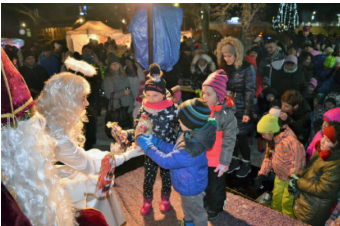
Mikuláš rozsvietil vianočný stromček, priniesol na námestie veľa pohody a dobrej nálady a potešil všetky deti sladkými darčekomí.....