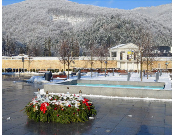
....a opäť prišiel advent a naše námestie zdebil adventný veniec...