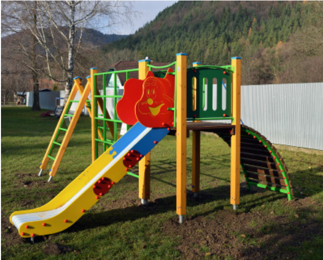
Nové hracie prvky potešili deti v Materskej škole Rajecké Teplice