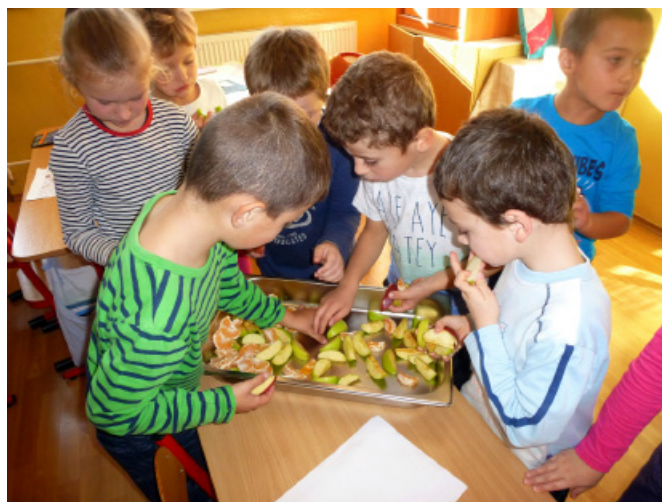
Deň zdravej výživy

Pedagogický zbor tvoria kvalifikovaní učitelia, 3 učiteľky ŠKD, kňaz, výchovný poradca, špeciálna pedagogička,