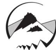
OZ Susedia spod Skaliek