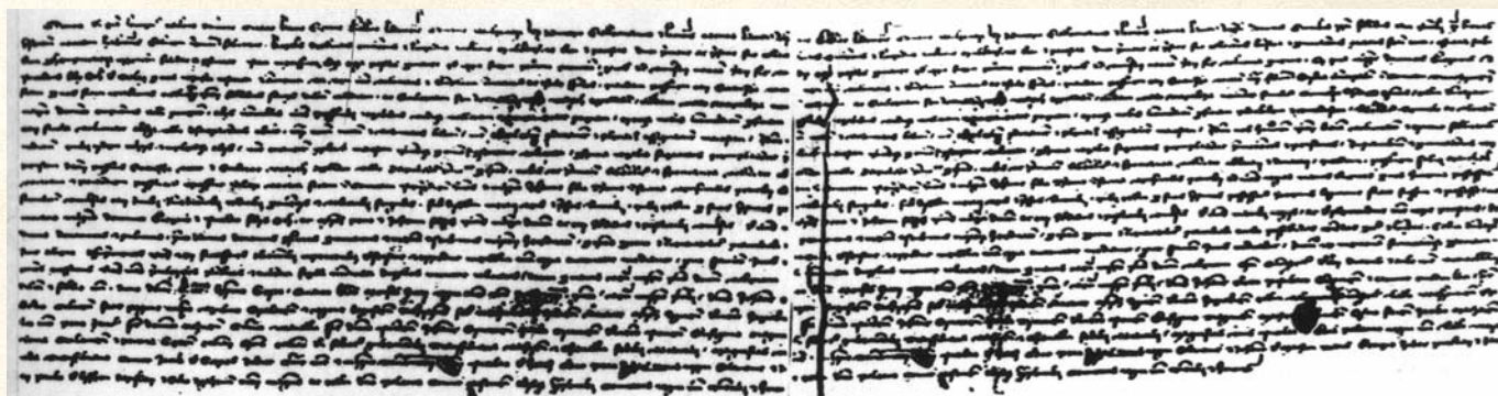
Listina uhorského kráľa Ľudovíta Veľkého s prvou písomnou zmienkou o Ražeckých Tepliciach z roku 1376