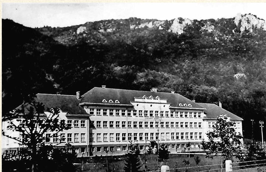
Liečebný ústav Baník, 1934