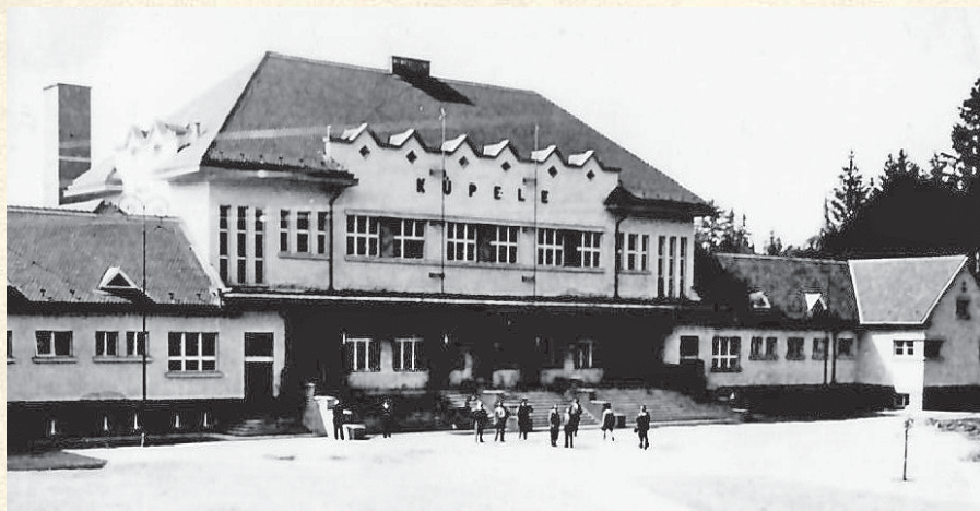
Kúpeľný dom v roku 1932