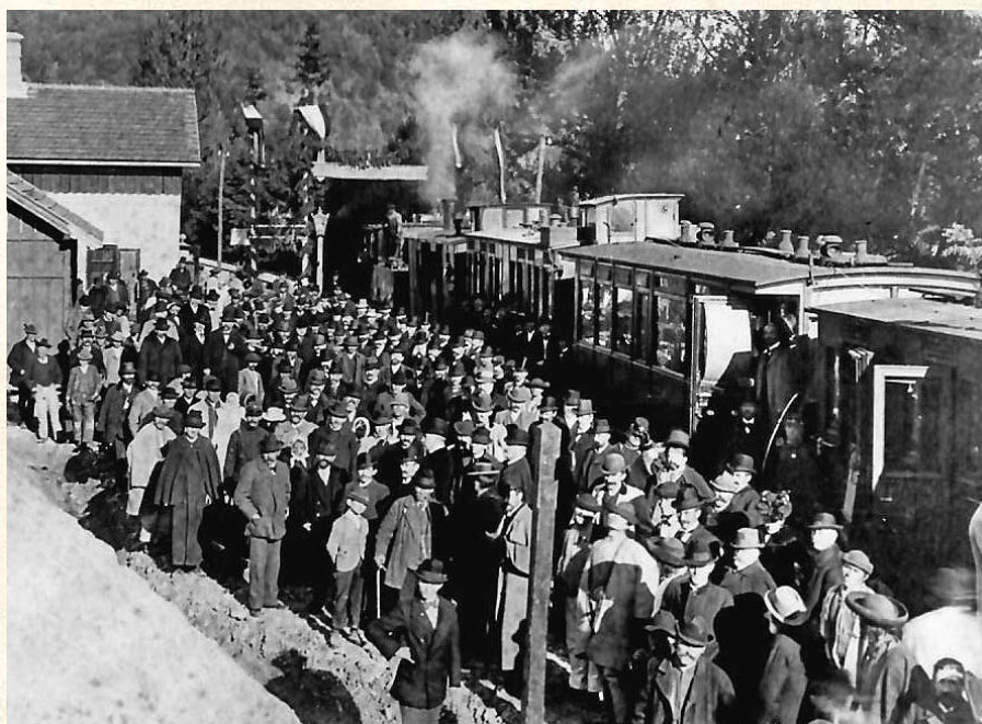
Prívanie prvého vlaku