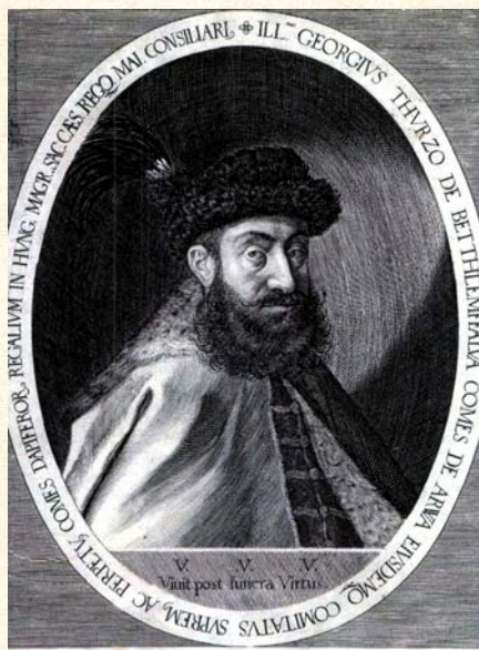
IS AMPLISSIMVS QVI SVA VIRTUTE IN ALTIORVM LOCVM PERVENIT NON QVI ASCENDIT PER ALTERIVS INCOMMODVM ET CALAMITATEM S. Ces. M. Iulijus Etylius Sadeker ad unum delinuit et D.D. Pragae M.D.C.VII.

V tomto období sa tu nachádzal panský (Pokračovanie na strane 8 - 9) »