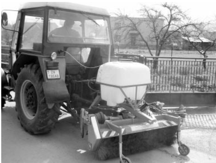
Zametacia metla ťahaná traktorom

V mesiaci marec z rozpočtu mesta bola zakúpená zametacia metla, ktorá má slúžiť na udržanie čistoty v meste. Toto zariadenie napomôže rýchlejšej a lepšej údržbe našich ciest. Ostáva dúfať, že bude bezporuchovo slúžiť dlhé roky.