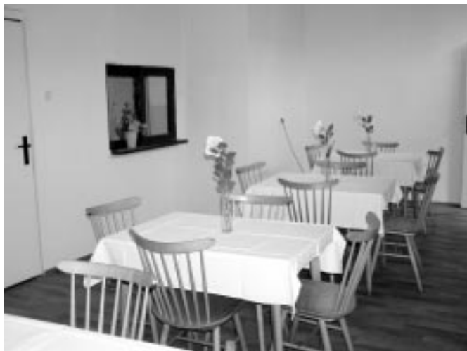
Nová výdajňa stravy v školskej jedálni

Mesto Rajec Teplice prebudovaním skladových priestorov školskej jedálne zriadilo výdajňu stravy. Občania majú možnosť stravu si odobrať domov, alebo ju priamo konzumovať v jedálni. Možnosť dovozu stravy ostáva tak, ako bolo doposiaľ.