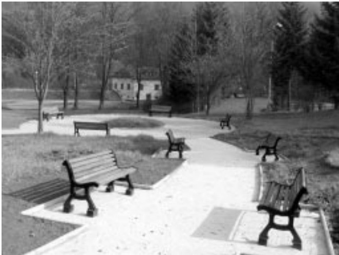
Časť oddychovej zóny

Nielen návštevníkom miestneho kostola, ale aj ostatným občanom a kúpeľným hosťom bude slúžiť oddychová zóna na Staničnej ulici. Terénnymi úpravami, dovozom lavičiek a výsadbou trávky skončila 1. etapa riešenia – Staničná ulica, parkovisko, Lipová alej.