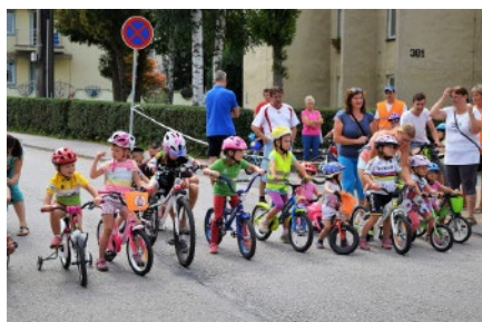
Najmenší pripravení na štart